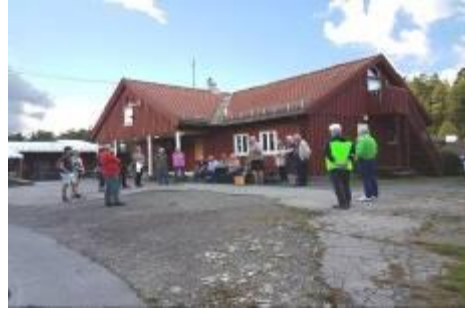
Lerdal gård på Prinsdal 11. september

http://www.kuv.no/nyheter/kulturminneuke.shtml