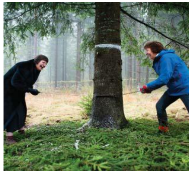
Julegrana. Illustrasjon fra Bymiljøetatens årsberetning 2015.

Oslo Kommune sendte i sommer på høring «Mål og retningslinjer for forvaltning og drift av Oslo Kommunes skoger 2016 – 2025», med høringsfrist 1. september. Styret i Oslo og Omland Friluftsråd ba om utsettelse på fristen og inviterte til et medlemsmøte i september der Bymiljøetaten informerte om arbeidet med planen og de fristene som nå gjelder. Det har vært bred deltagelse fra en rekke interessenter i prosessen. Arbeidet ble delt opp i flere grupper. Flere formuleringer om hensyn til «myke verdier» var strøket underveis. Det kan derfor ligge an til konflikt mellom ulike marka-interesser. En fra styret var tilstede på medlemsmøtet.