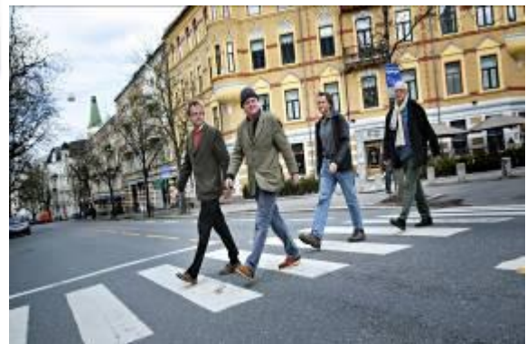
Fra Aftenposten. 4 styremedlemmer kjemper for å bevare Bygdø alle.