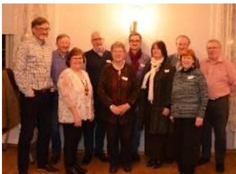
Nytt styre i KUV (Oslo Velforbund). Se side 7 om styrets sammensetning