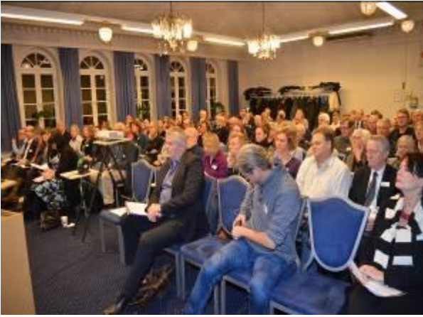
Kulturminneseminar i Håndverkeren i januar

Velforeningene har en viktig oppgave med å spre kunnskap om kulturminner og om kulturmiljøer, dvs. om kvaliteter i miljøene for de som bor der og som det er lett å overse i fortettingssammenheng. Kulturminnenes betydning i lokalmiljøene må komme til uttrykk i høringsuttalelser i plansaker. Det ble et vellykket seminar, selv om flere av temaene ble noe almene og topptunge for lokale vel spesielt i småhusområdene.