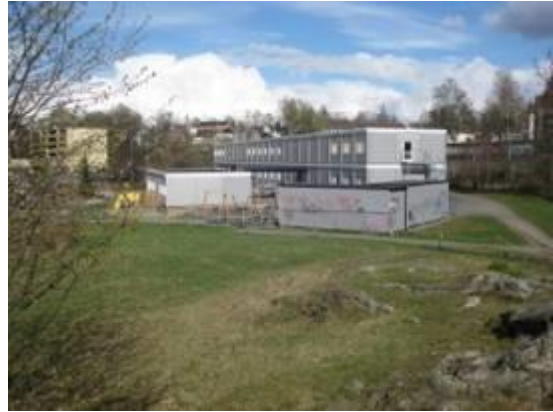
Midlertidig barnehage.

SEIER FOR OLA NARR PARKEN - den midlertidige barnehagen skal fjernes