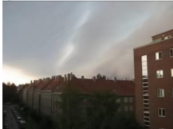
Uvær på Marienlyst

Marienlyst Vel følger opp politiske prosesser i saker som angår nærområdet, for å sikre de mange interessene til beboere her. I mange år har Marienlyst vært Norges tettest befolkede område, og er kjent for en rekke blokker som er bygget i funksjonalistisk stil. Marienlyst og Fagerborg rommer også mange eiendommer preget av nybarokk, villaer og townhouse.