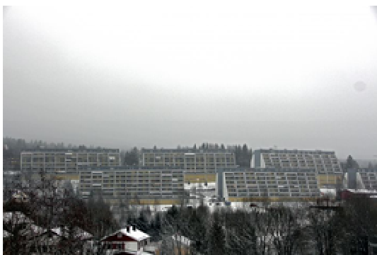
Vestliområdet – fra Akers Avis Groruddalen

komme på tilsyn. Men det virket som det var vanskelig å få PBE til å komme og iverksette tiltak ute på Brenna.