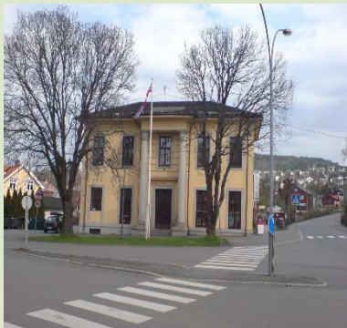
Svetter'n – lokalet til Grefsen og Disen vel. Årsmøtet til KUV skjer her tirsdag 25. mars.