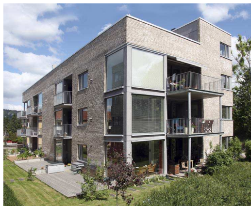
Røa Have

PBE har nylig utgitt samlingen ”God fortetting i Oslo.” Dette er en eksempelsamling på gjennomførte fortettinger i eksisterende boligområder fra de siste 10 årene. Samlingen finnes på nettsiden til PBE eller lastes ned fra: . http://tinyurl.com/8hduavc Der kan man se om man er enig i at dette er gode eksempler på fortetting