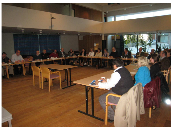
Møtet med vel og borettslag i Søndre Nordstrand bydel 12/4

-I de bydelsvise møtene kan vellene utveksle erfaringer, høre om nye tiltak i bydelen og bringe til torgs felles interesser og behov vis a vis bydelen.