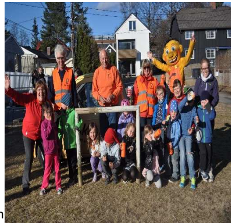
Rusken i mai

Vårt område ligger nord i bydelen Grünerløkka. Her jobber vi sammen for å skape et trivelig og trygt bomiljø. Jubileumsåret har vært preget av hyggelige aktiviteter for alle. På Rusken i mai fikk vi besøk av Rusken-generalen og maskotten, og Hasle skole musikkorps spilte i gatene.