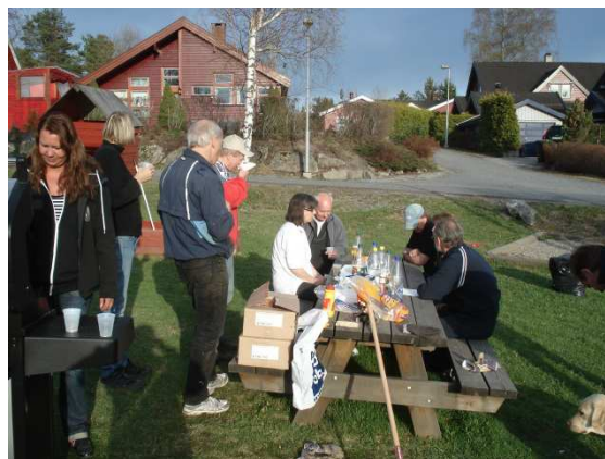
Dugnad i Brenna vel

Styret for Brenna velforening forvalter området på vegne av fellesskapet og tar initiativ for å vedlikeholde fellesarealene. Styremedlemmene har ikke ansvar for å gjennomføre slike tiltak alene. Alle som bor på Brenna forventes å bidra etter evne. Det arrangeres derfor Rusken over 2 dager hver vår samt dugnader etter behov. Vi har en aktiv lekeplasskomite.